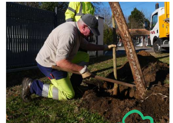
Plantations rue Françoise Sagan