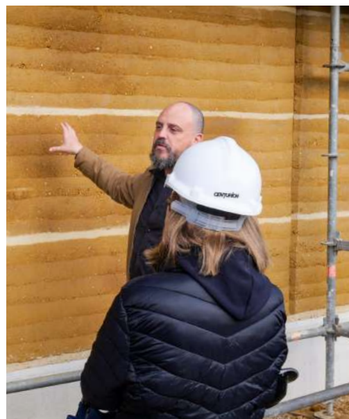
Des murs en pisé pour le 4 ème groupe scolaire