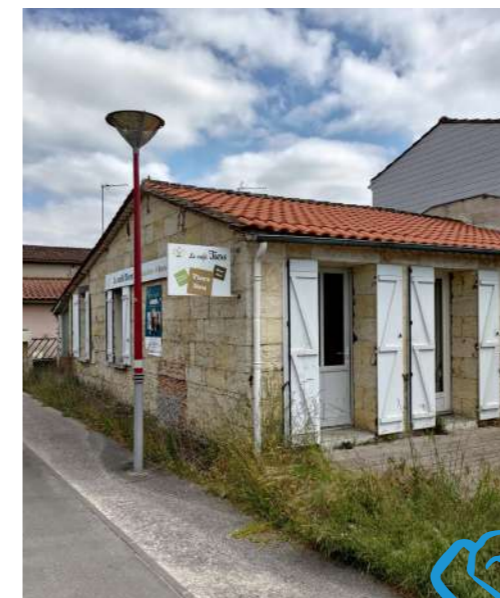
Futur poste de Police, actuellement Café Tiers