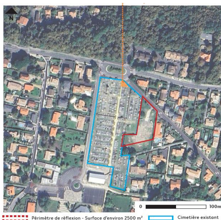
Figure 3 : Localisation du projet d'extension